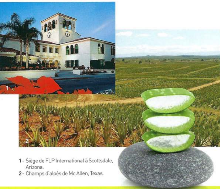
1 - Siège de FLP International à Scottsdale, Arizona.

En France, Forever Living Products est aujourd'hui un des leaders de la vente directe par réseaux. Présente depuis 1993, la filiale n'a cessé d'accroître son chiffre d'affaires. Elle s'est implantée dans les DOM dès 1995 avec des agences en Guadeloupe, en Martinique, à La Réunion et en Guyane. Plus récemment, Forever France a ouvert des filiales au Maroc et à l'île Maurice.